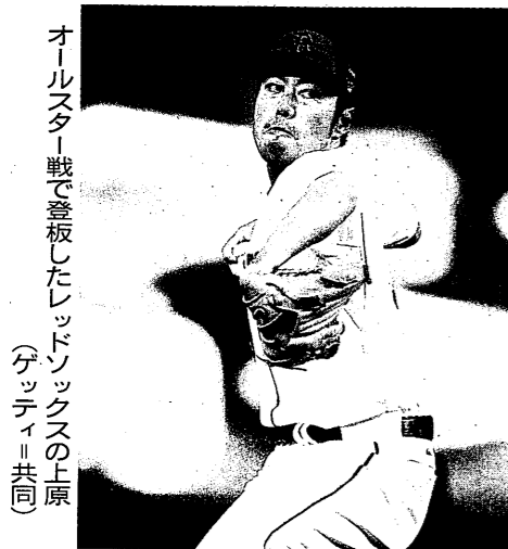
オールスター戦で登板したレッドソックスの上原

米大リーグはウェートン・ゼネラルマネジバーを総務にトレードできる期限が今月いっぱいである。昨季ワールドシリーズを制したレッドソックスが「売り手」になるかどうかに注目が集まり、米メディアは抑えの上原ら主力投手をトレード要員に挙げている。前半戦は43勝52敗でア・リーグ東地区の最下位と低迷。チェリン 米大リーグはウェートン・ゼネラルマネジバーを総務にトレードできる期限が今月いっぱいである。昨季ワールドシリーズを制したレッドソックスが「売り手」になるかどうかに注目が集まり、米メディアは抑えの上原ら主力投手をトレード要員に挙げている。前半戦は43勝52敗でア・リーグ東地区の最下位と低迷。チェリン